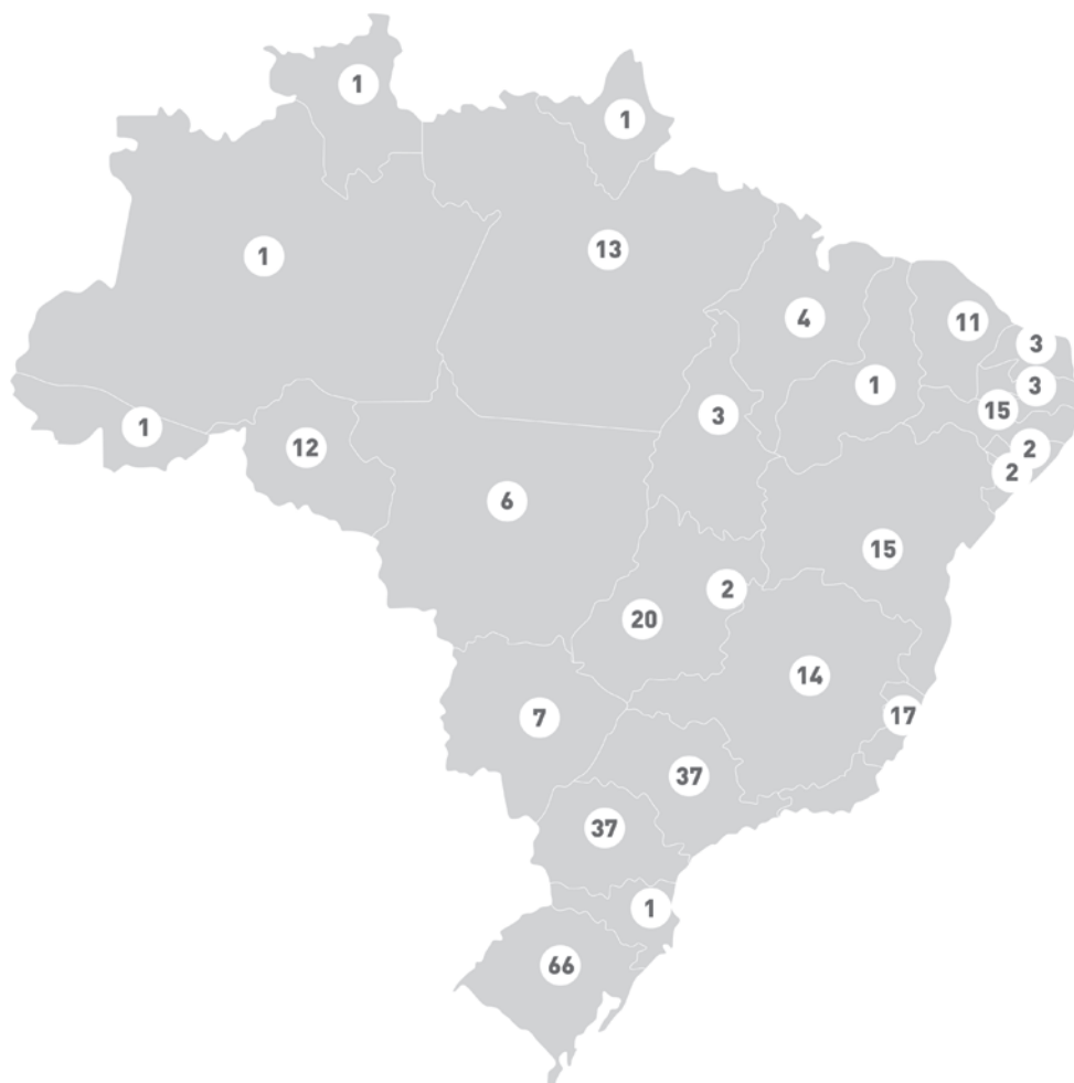
Quantidade de salas para transmissão de cursos via satélite por Estado.

Confira na página seguinte como funciona essa ideia da AASP que está a serviço do conhecimento do advogado.