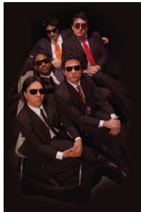
Integrantes da peça Por que os homens mentem?

Como você pôde observar, a AASP está preparando muitas atrações especiais para a Semana da Mulher em Flores. Então, reserve na sua agenda a semana de 5 a 9 de março e venha usufruir conosco de muita diversão, conhecimento e arte! Para conferir toda a programação, acesse o site www.aasp.org.com.br/semanadamulher .