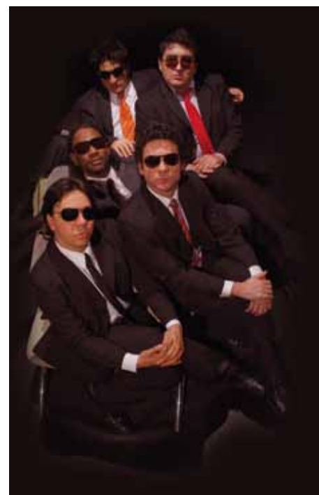
Integrantes da peça Por que os homens mentem?

e cerâmica, e nas sessões de massagem. Para mais informações sobre a programação e a compra de ingressos para o teatro, o show ou as palestras, acesse o site www.aasp.org.com.br/semanadamulher .