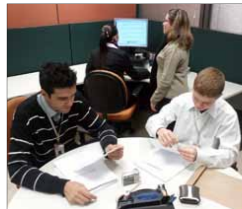
Equipe de São Paulo

Em São Paulo, todos os serviços são realizados pela equipe do setor de Retirada de Acórdãos, que diariamente visita os seguintes locais: TRF da 3ª Região, TRE, TRT da 2ª Região, TJM, Tribunal de Justiça, TIT (Tribunal de Impostos e Taxas) e Fórum João Mendes (Distribuidor).