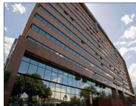
Escritório de Brasília

Portanto, entre em contato com a AASP e aproveite mais esses benefícios. Para informações sobre prazos de entrega do material, formas de pagamento e peculiaridades sobre os diversos locais visitados pelas equipes, é só acessar rapidamente o regulamento no endereço eletrônico da AASP, www.aasp.org.br , “Outros Serviços”, “Retirada de Acórdãos em São Paulo” ou “Escritório de Brasília”, ou ligar para (11) 3291 9200.