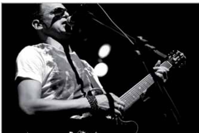
Nos shows que o cantor e compositor Cláudio Zoli faz pelo Brasil, o público delira ao som de sucessos como “Noite do prazer”, “À francesa” e “Cada um cada um (a namorada)”.

Chegou a hora de participar da Semana Cultural Digital da AASP. Durante toda esta semana, entre os dias 6 e 10 de agosto, a sede da Associação estará repleta de novidades para todos os associados, assinantes e convidados. A programação especial conta com um show do cantor e compositor Cláudio Zoli e a peça teatral 12 homens e uma sentença .