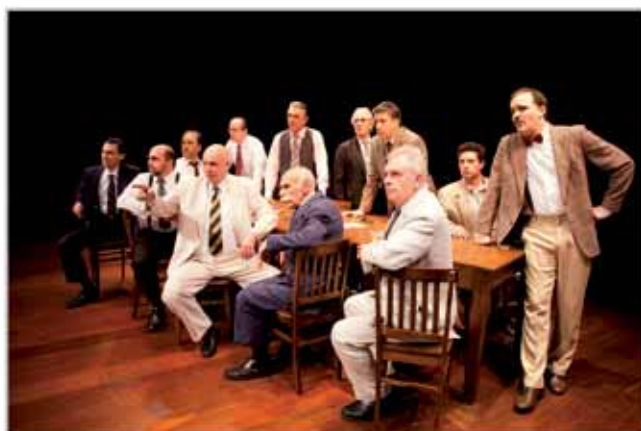
Na peça, 12 jurados devem decidir se condenam ou não à morte na cadeira elétrica um jovem acusado de assassinar o pai. Surpreendente exercício de argumentação e conflito de paixões acirradas.

E ainda, exibição de filmes, exposição, massagem e muito mais. Confira a seguir os dias e horários de cada atração e participe!