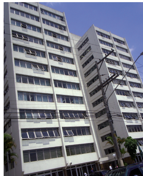
Fórum de Santo Amaro

A Associação também tem voltado sua atenção para a comarca de Bauru, pois realizará, no dia 28 de setembro, o seu II Simpósio de Direito na cidade e por isso entendeu ser oportuno oferecer aos associados da região a possibilidade de participar da campanha “De Olho no Fórum”. Os resultados serão apresentados durante o II Simpósio de Direito AASP. “Pareceu-nos importante levar aos diretores dos fóruns de Bauru os resultados da pesquisa para que eles saibam como os associados e os advogados da região veem a prestação de serviço de cada um desses fóruns. É certo que, desse modo,