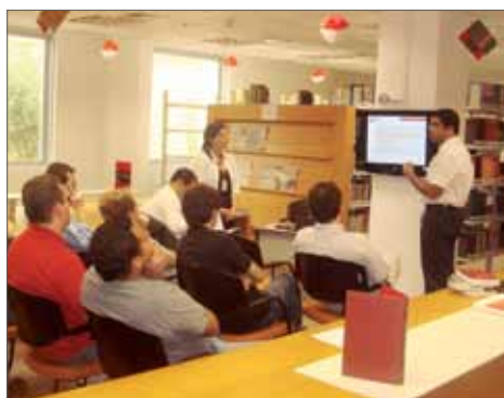
Minipalestra “Normalização de trabalhos acadêmicos” - out/2010

ção especial, que contou com atividades diárias realizadas na Biblioteca e em outros locais dentro da Associação. O incentivo à leitura é muito importante. Uma pesquisa divulgada este ano mostra que o brasileiro lê em média quatro livros por ano, sendo que, destes, lê integralmente apenas dois, de acordo com dados do Ibope Inteligência, encomendados pelo Instituto Pró-Livro.