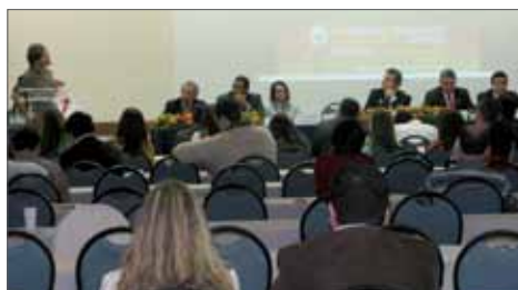
XXXI - Congresso AATSP - Campos dos Jordão-SP