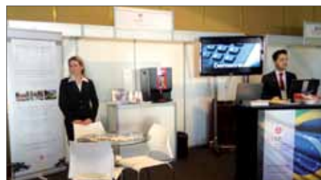
IBDFAM - Gramado-RS