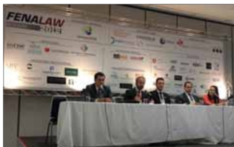
Centro de Convenções Frei Caneca - SP

De 17 a 19 de outubro, no Hotel Maksoud Plaza, aconteceu o XXVI Congresso Brasileiro de Direito Tributário, evento que contou com a participação de 150 pessoas e reuniu em sua programação abrangentes discussões sobre o segmento, como, por exemplo, o módulo do Direito Concorrencial e Penal, que analisou, em meio a outros assuntos, os aspectos