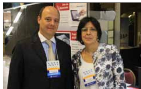
XXVI - Direito Tributário - Hotel Maksoud Plaza - SP