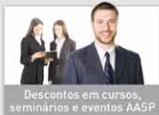
Descontos em cursos, seminários e eventos AASP