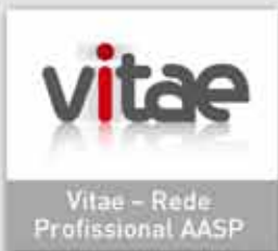
Vitae - Rede Profissional AASP