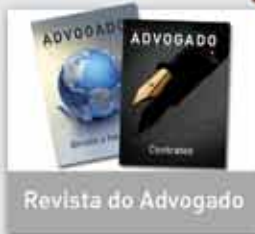
Revista do Advogado