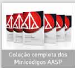
Colecção completa dos Minicódigos AASP

Conheça os principais produtos e serviços: