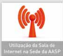
Utilização da Sala de Internet na Sede da AASP