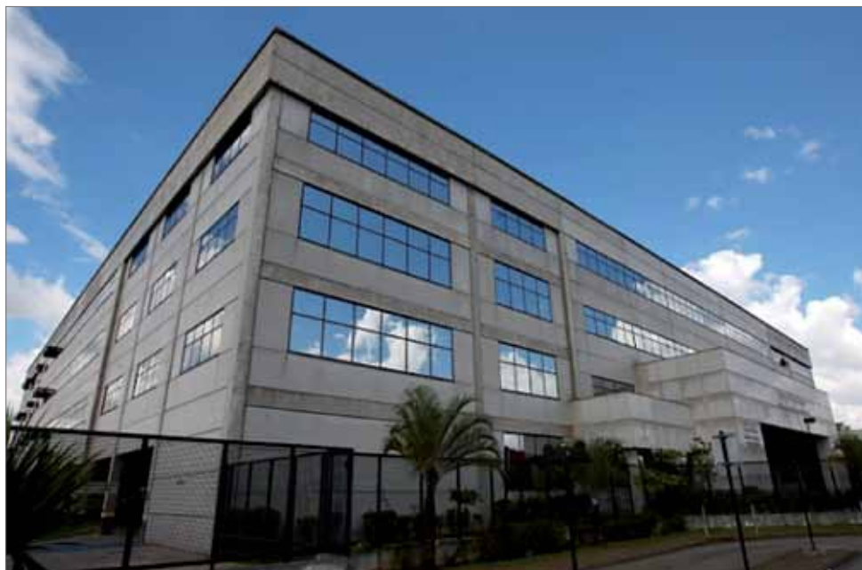
Fórum Regional de Santana