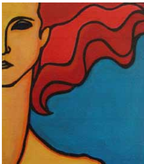
Artista: Andréa Nunes

Foto Diva – no dia 8 de março, das 13 h às 19 h, as mulheres também poderão aproveitar para ter um momento de diva e tirar uma foto profissional. Esta é mais uma novidade do evento deste ano. Preparamos um estúdio com iluminação especial e fotógrafo profissional. As modelos fotografadas poderão acessar, após o evento, suas fotos (duas por participante) no site da Semana da Mulher.