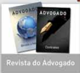
Revista do Advogado