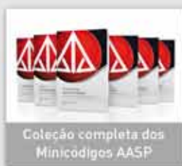
Coleção completa dos Minicódigos AASP

Conheça os principais produtos e serviços: