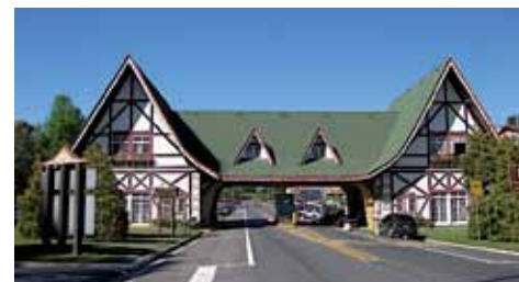
Campos do Jordão-SP