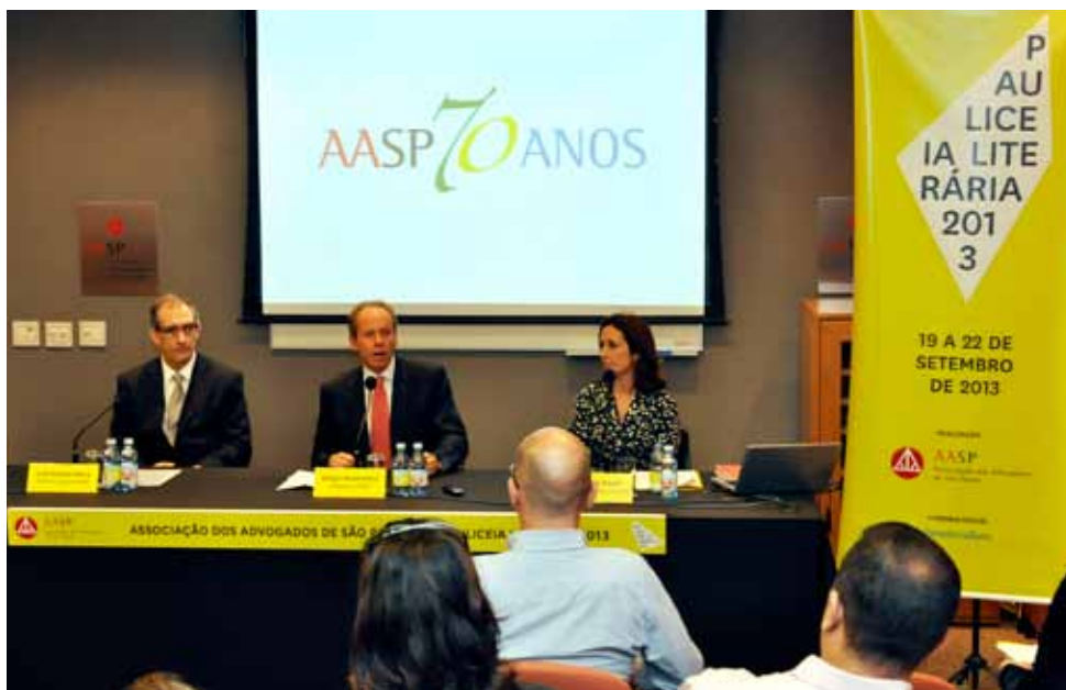
Coletiva de lançamento do Pauliceia Literária 2013 realizada no dia 9 de abril.