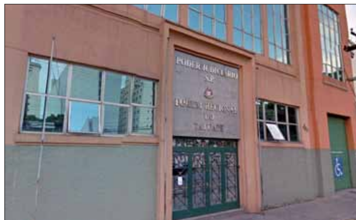
Fórum Regional do Tatuapé

As respostas obtidas pela campanha possibilitam mensurar os problemas e avaliar o