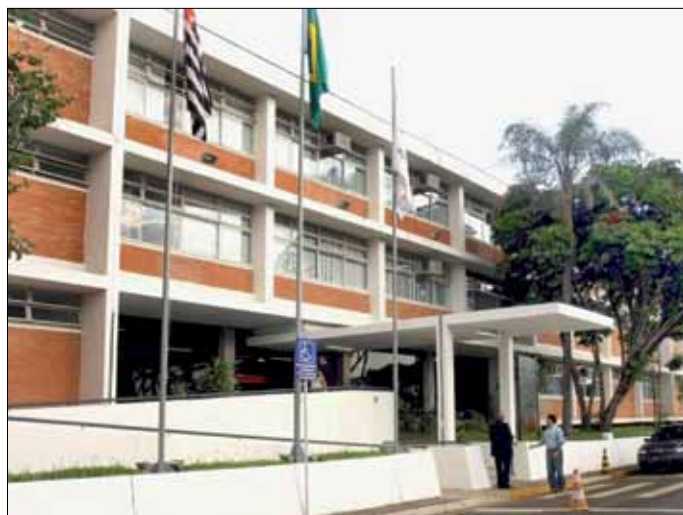
Comarca de Campinas