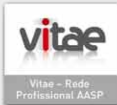
Vitae – Rede Profissional AASP