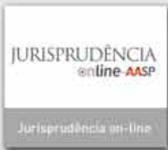
JURISPRUDÊNCIA online AASP