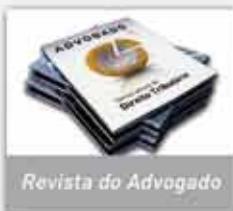
Revista do Advogado