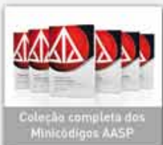
Coleção completa dos Minicódigos AASP

Conheça os principais produtos e serviços: