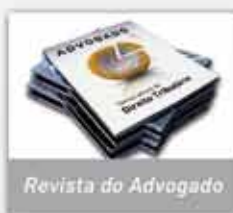
Revista do Advogado