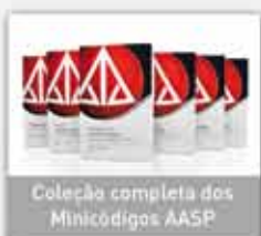
Coleção completa dos Minicódigos AASP

Conheça os principais produtos e serviços: