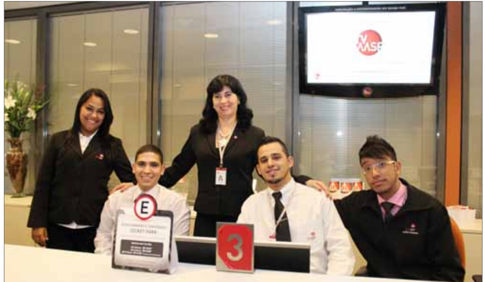
Equipe de atendimento presencial

Na impossibilidade de comparecer à sede da AASP, o usuário poderá solucionar algumas dúvidas por telefone. São