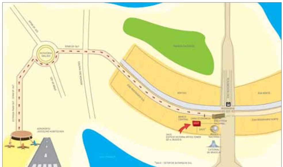
Localização do novo escritório de Brasília