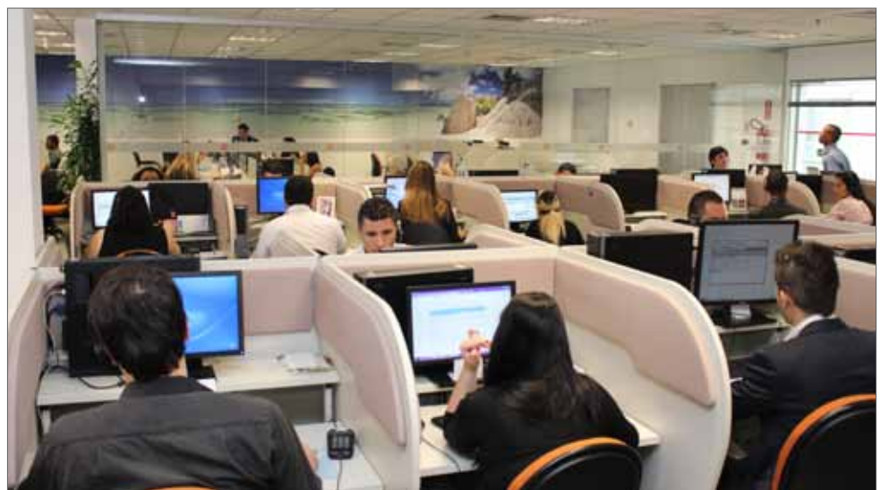
Equipe de atendimento por telefone

tamento tem como missão construir o relacionamento da AASP com o associado, auxiliá-lo em suas solicitações, reclamações e sugestões, além de solucionar suas manifestações sobre os mais variados assuntos da advocacia. Entre em contato pelo telefone (11) 3291 9200 ou, para dúvidas relacionadas ao peticionamento eletrônico, as ligações advindas de outras localidades fora da capital de São Paulo devem ser feitas para 0800 777 5656.