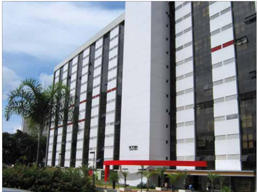
Edifício Victoria Office Tower

Para mais informações sobre os serviços prestados pelo Escritório da AASP em Brasília, consulte o regulamento no site da AASP, www.aasp.org.br/aasp/servicos/brasilia/regulamento.asp , ou ligue para o Serviço de Atendimento ao Associado, no telefone (11) 3291 9200, ou diretamente para (61) 3226 8215/3224 6606/3223 8465/ Fax: (61) 3224 3885.