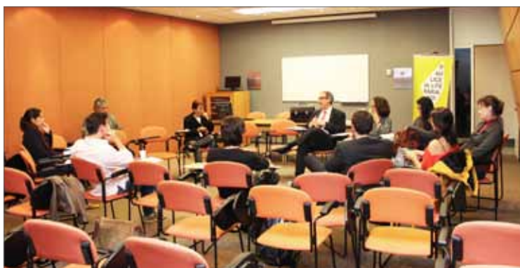
Grupo de leitura na sede da AASP.