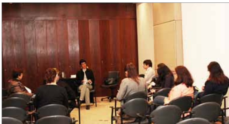
Grupo de leitura no CCBB.