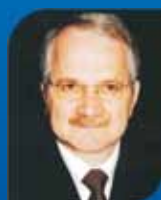
Luiz Edson Fachin VICE-PRESIDENTE DO IBDCivil