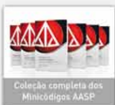
Coleção completa dos Minicódigos AASP

Conheça os principais produtos e serviços: