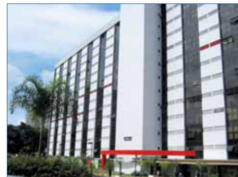
Escritório de Brasília: Edifício Victoria Office Tower Quadra 4 - Bloco A - Sala 1.234 Setor de Autarquias Sul (Saus)

O objetivo da AASP ao oferecer todos esses serviços nas Salas dos Advogados de São Paulo e no Escritório de Brasília é colaborar com os profissionais na otimização de tempo, sem a necessidade de grandes deslocamentos que poderiam ocupar um tempo precioso na sua rotina. Para mais informações sobre a utilização do benefício, ligue para (11) 3291 9200.