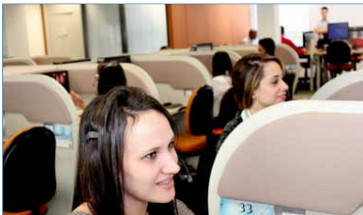
Setor de Atendimento AASP.

utilização do seguro de vida, o endereço e telefone dos diversos órgãos públicos, valores e guia para recolhimento de custas processuais, competência territorial e tantos outros assuntos. Muitos associados entram em contato conosco para confirmar detalhes sobre a prestação desses serviços, qual o custo e outras peculiaridades de cada produto ou serviço oferecido pela Associação.