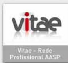
Vitae - Rede Profissional AASP