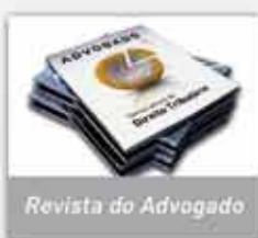
Revista do Advogado