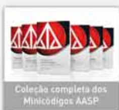
Coleção completa dos Minicódigos AASP

Conheça os principais produtos e serviços: