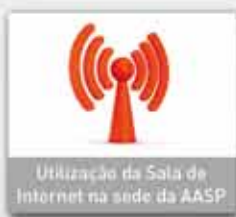
Utilização da Sala de Internet na sede da AASP