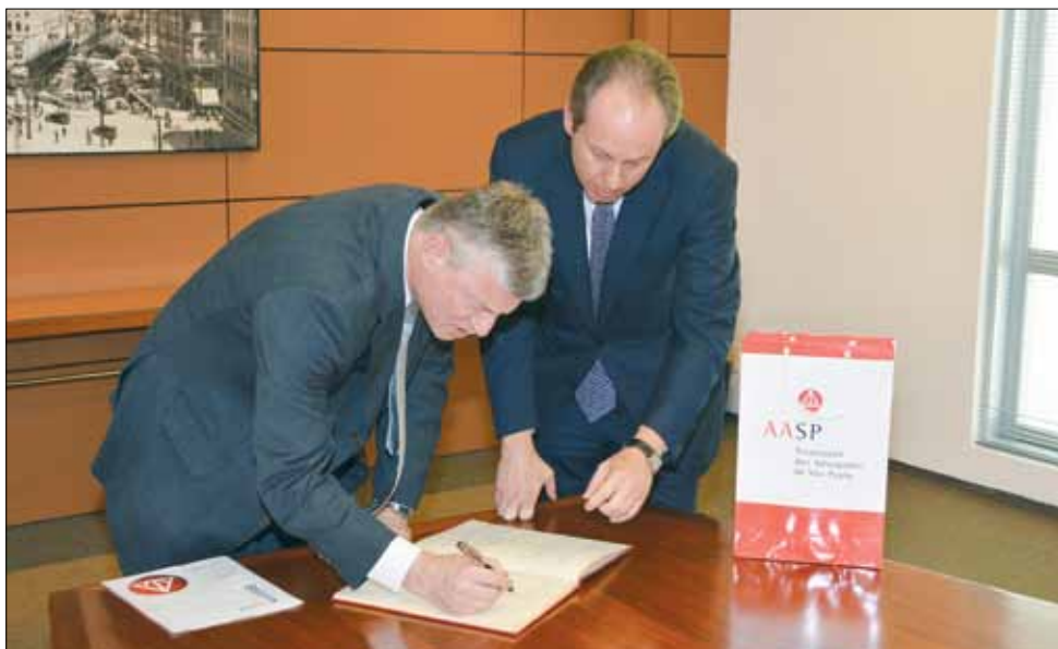
Presidente do TRT da 15ª Região assina livro de visitas da AASP.

cooperação entre a advocacia e a magistratura na solução dos problemas e dificuldades que se apresentam constantemente. É um alento para a classe dos advogados que o TRT da 15ª Região seja conduzido por uma pessoa dinâmica, séria e comprometida, como é o caso do desembargador Flavio de Campos Cooper”. ■