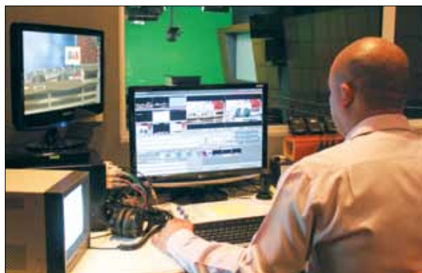
Estúdio de gravação dos cursos telepresenciais.