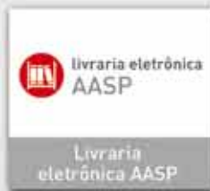
Livraria eletrônica AASP