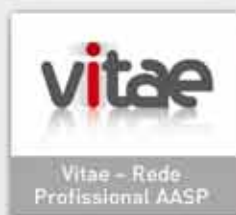
Vitae – Rede Profissional AASP