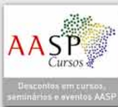
Descontos em cursos, seminários e eventos AASP