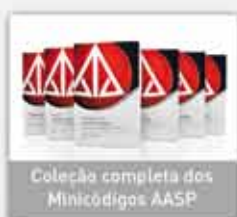
Coleção completa dos Minicódigos AASP

Conheça os principais produtos e serviços: