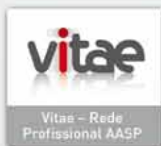
Vitae - Rede Profissional AASP