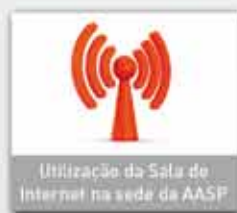
Utilização da Sala de Internet na sede da AASP