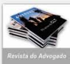
Revista do Advogado