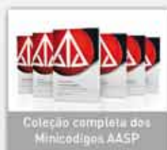
Coleção completa dos Minicódigos AASP

Conheça os principais produtos e serviços: