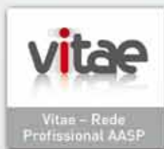
Vitae – Rede Profissional AASP