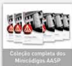
Coleção completa dos Minicídigos AASP

Conheça os principais produtos e serviços: