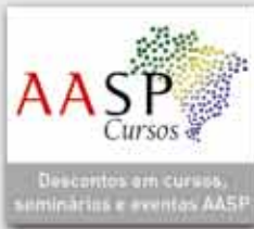
Descontos em cursos, seminários e eventos AASP