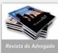
Revista do Advogado