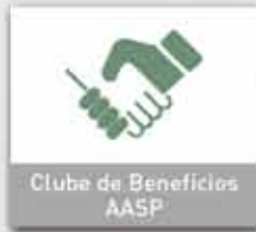
Clube de Benefícios AASP