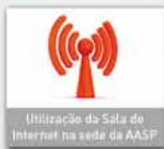
Utilização da Sala de Internet na sede da AASP