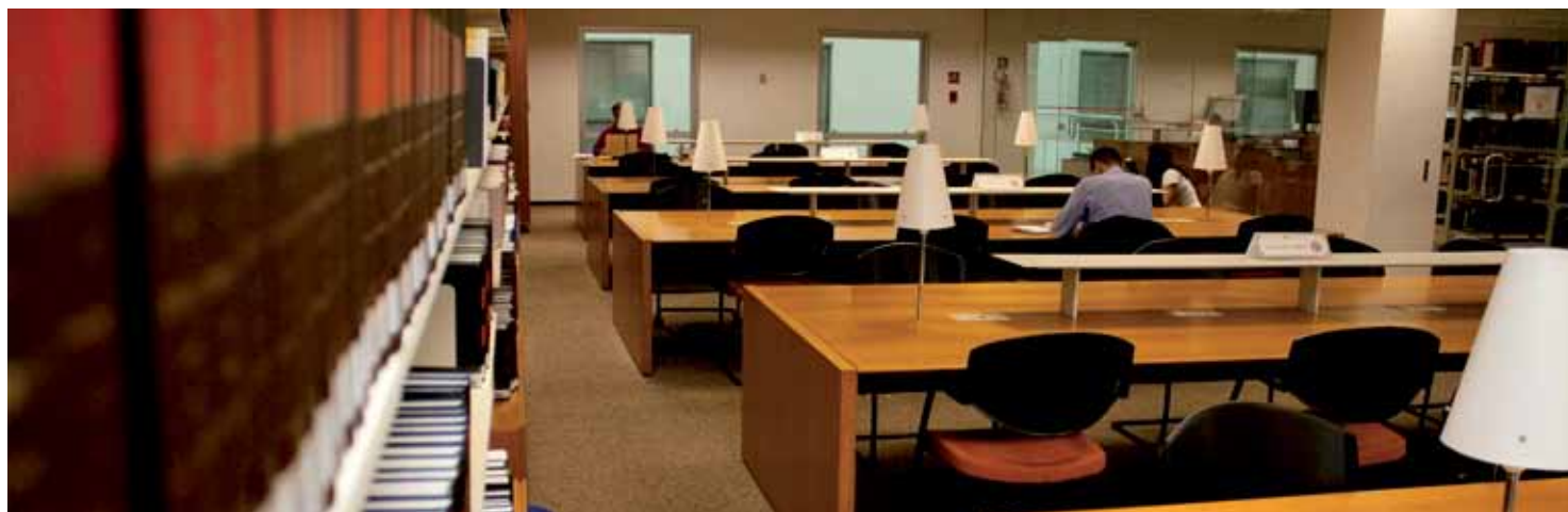
Sala de estudos.