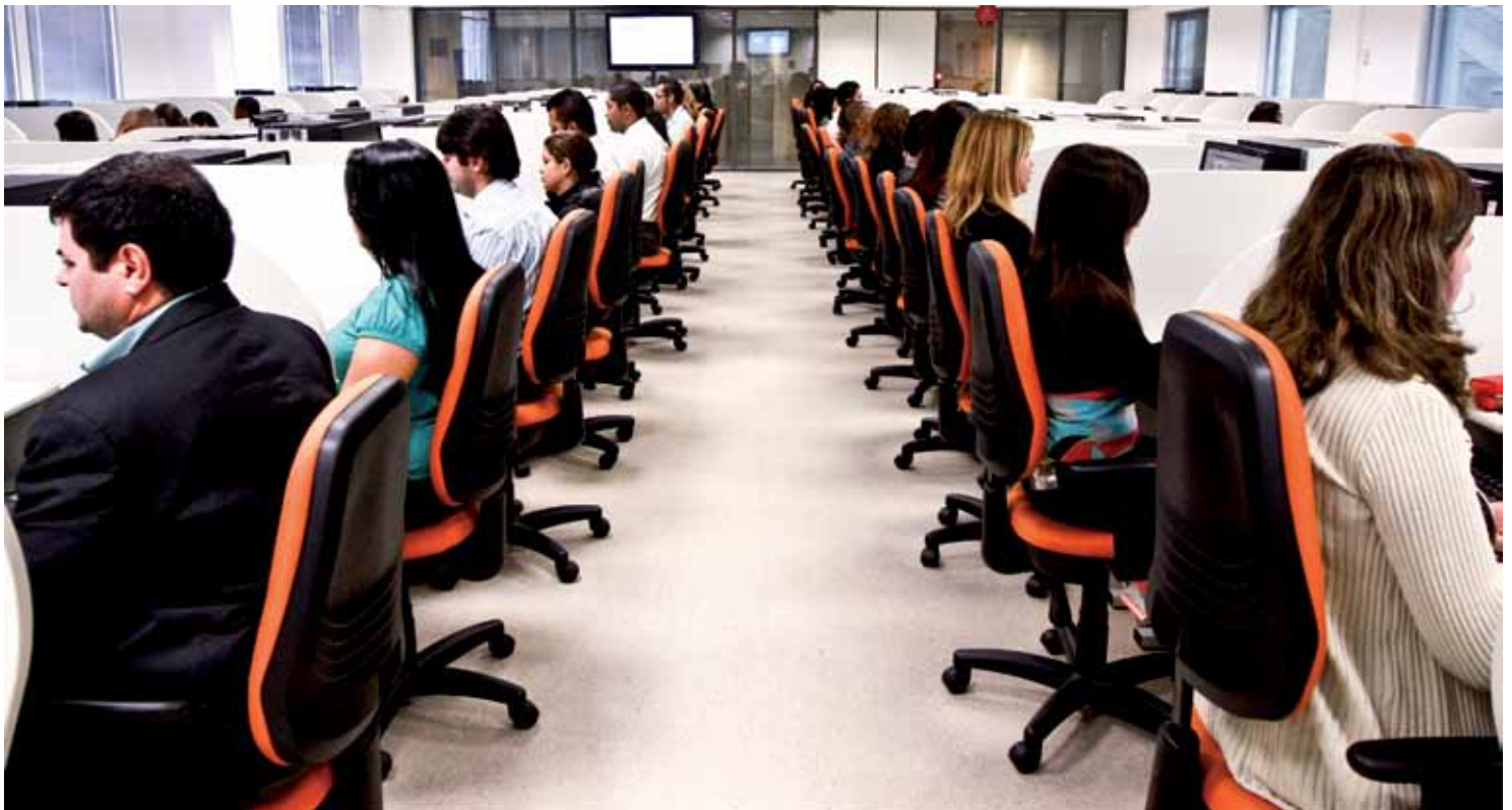
Equipe de Operações da AASP.