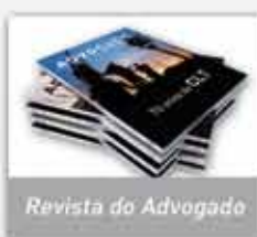
Revista do Advogado