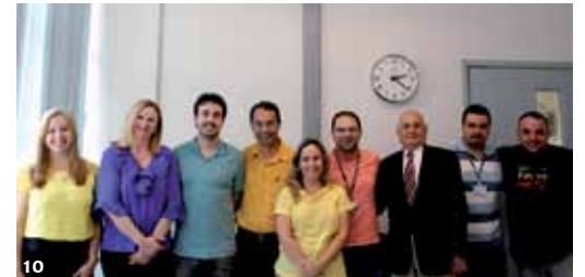
1. 1º Ofício Criminal do Fórum da Comarca de Itapevi. 2. Ofício do Juizado Especial Cível de Barueri. 3. 3ª Vara da Justiça do Trabalho de Barueri. 4. Comarca de Barueri. 5. 1ª Vara Cível de Carapicuíba. 6. 2ª Vara da Justiça do Trabalho de Santana do Parnaíba. 7. Execuções Fiscais de Barueri. 8. Comarca de Barueri. 9. 6º Ofício Cível da Comarca de Barueri. 10. Secretaria da Justiça do Trabalho de Itapevi.