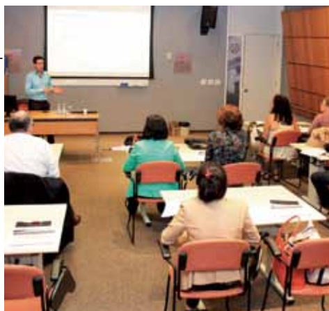
Workshop de fotografia