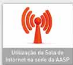
Utilização da Sala de Internet na sede da AASP