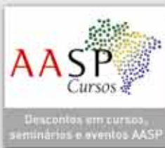
Descontos em cursos, seminários e eventos AASP