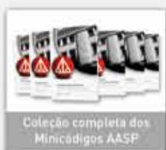
Coleção completa dos Minicodigos AASP

Conheça os principais produtos e serviços: