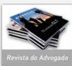
Revista do Advogado