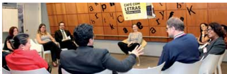
Evento realizado em 7 de abril na sede da AASP.

preciso haver amor entre os inimigos para que haja paz, para que eles parem de atirar e matar e vivam como vizinhos. Só precisamos de paz, não necessariamente de amor”, afirmou, na ocasião. Como pano de fundo, o romance A caixa-preta também trata dos conflitos existentes entre