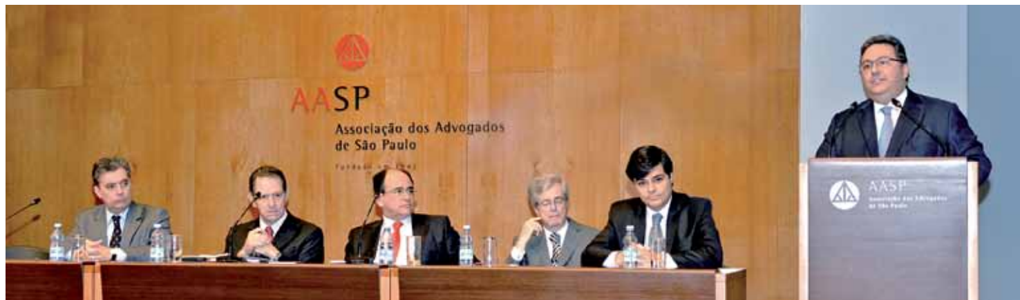
Abertura do 6º Seminário sobre o Superior Tribunal de Justiça