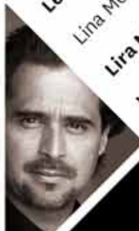
José Eduardo Agualusa