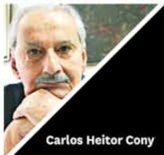
Carlos Heitor Cony

Grandes nomes da literatura nacional e internacional esperam por você na sede da AASP.