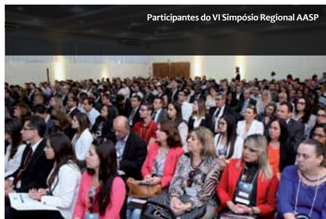
Participantes do VI Simpósio Regional AASP

O próximo Simpósio Regional AASP será realizado no dia 2 de outubro, em Ribeirão Preto.