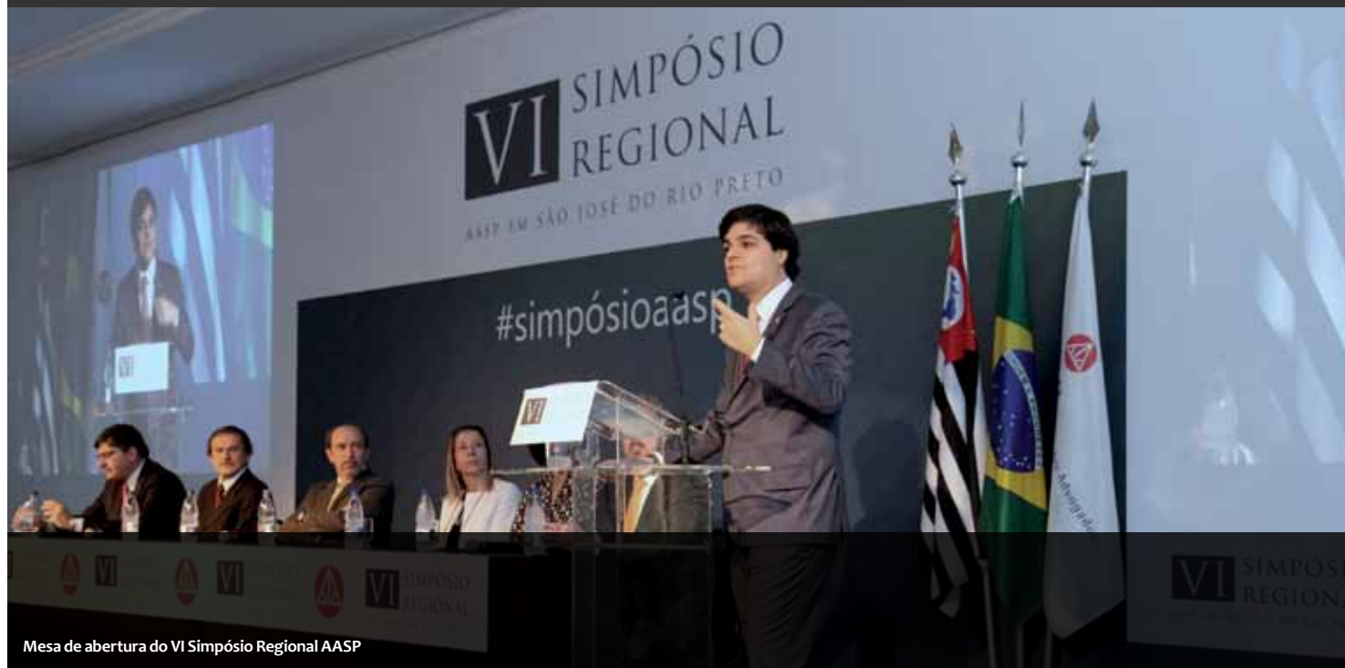
Mesa de abertura do VI Simpósio Regional AASP