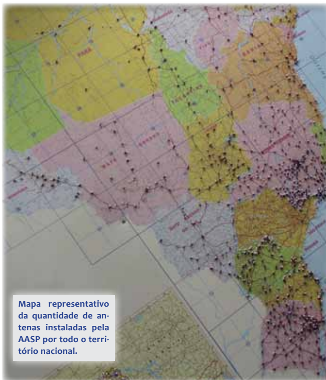
Mapa representativo da quantidade de antenas instaladas pela AASP por todo o território nacional.

entre as instituições é de absoluto interesse para o mundo jurídico e para o desenvolvimento acadêmico das regiões. “A parceria é de suma relevância para o advogado e os estagiários, considerando a oportunidade de aproximação de renomados professores e