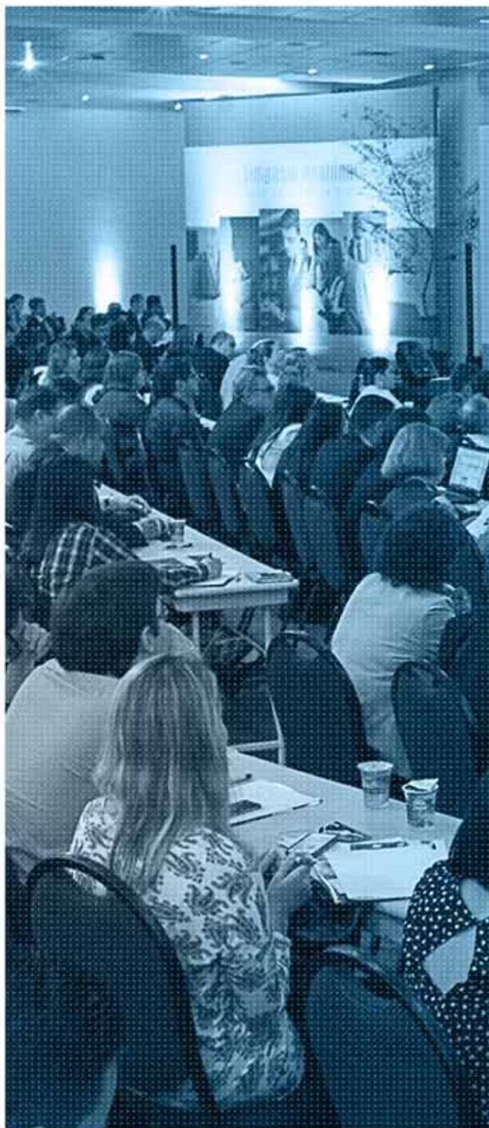
Programação sujeita a alterações.