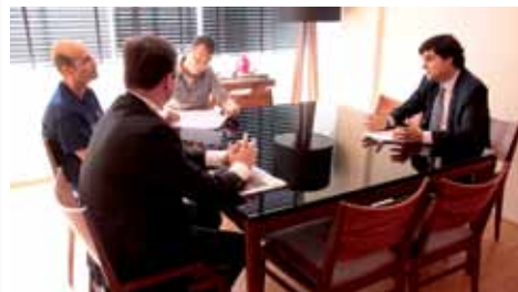
Sede da Rádio CBN Campinas.