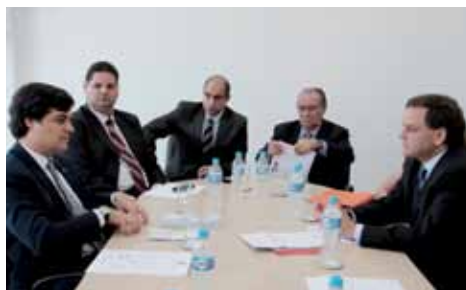
OAB de Campinas.