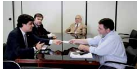
Secretaria Municipal de Assuntos Jurídicos de Campinas.