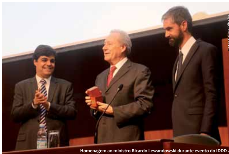
Homenagem ao ministro Ricardo Lewandowski durante evento do IDDD.

nagear o ministro: “A homenagem ao ministro Lewandowski foi prestada pelo trabalho realizado à frente do CNJ e principalmente pela iniciativa pioneira na implantação dos projetos-piloto das audiências de custódia, absolutamente essenciais para se modificar a cultura de encarceramento no país, para mostrar uma alternativa à prisão, que deve ser destinada para aquelas pessoas que necessariamente devem estar presas, fazendo um filtro muito mais eficaz da necessidade ou não da prisão”.