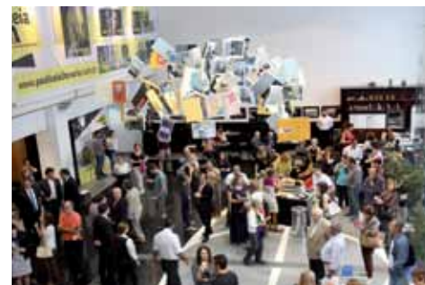
Hall principal do evento.

Este ano o Pauliceia foi precedido por um Ciclo de Cinema, que homenageou o cineasta Héctor Babenco, falecido em julho deste ano. Foram exibidos os filmes: Pixote , a Lei do Mais Fraco ,