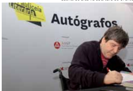
Autógrafos de Marcelo Rubens Paiva.