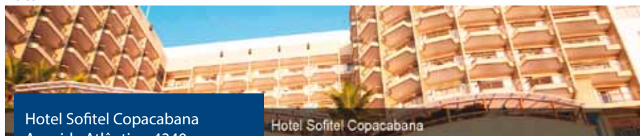
Hotel Sofitel Copacabana Avenida Atlântica, 4240 Copacabana, Rio de Janeiro-RJ