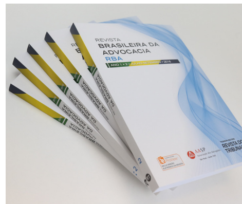
Nova edição da RBA.

modo geral, e mais, a parceria firmada entre a Associação e a OAB-PR trouxe também como resultado positivo a edição de um Código de Processo Civil anotado, atualmente disponível tanto no formato impresso como eletrônico, acessível a todos os advogados, associados AASP ou não. “A parceria com a OAB-PR está consolidada. Contamos com 43 antenas espalhadas pelas subseções do Estado, reforçando a vocação nacional da AASP, que há alguns anos apresenta-se forte também em outras regiões – atualmente, a Associação conta com associados em todos os Estados da Federação – e mais, reforça