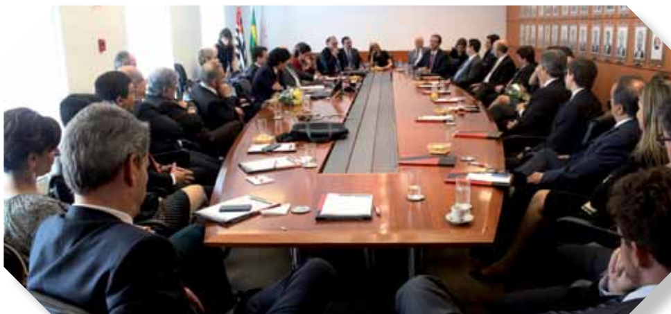
Reunião dos conselheiros e ex-presidentes da AASP realizada no dia 14 de dezembro de 2016.

“Mas não é só. A AASP, para 2017, já está fazendo mais. Embora todos nós saibamos que as contribuições associativas estão relativamente baixas diante dos serviços que são prestados aos nossos associados, sensível à situação de crise econômica nacional, o Conselho referendou a manutenção do valor das mensalidades e, por isso, nós não vamos ter reajustes em