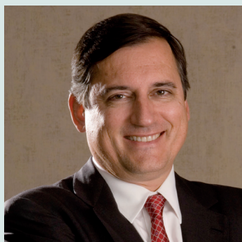
Por José Antonio Fichtner