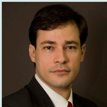
Por André Luís Monteiro