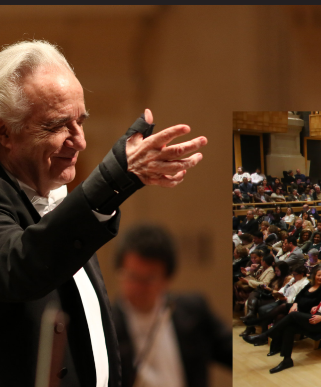
Maestro João Carlos Martins.

marcado na memória de todos com tons de Mozart, Beatles, Queen, Trem das Onze cantado em coro e a obra-prima do regente, dessa vez, sem a batuta, mas no piano com o Hino Nacional. Uma homenagem da AASP ao Dia do Advogado, que, com seus mais de 90 mil associados, não poderia colocar todos neste espaço, mas aqui quer compartilhar alguns cliques desta grande noite.